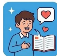
W ZAUFANEJ OSOBE

Nie bój się rozmawiać o swoich uczuciach - nawet, jeżeli ciężko jest Ci je opisać. Drzwi wychowawcy, psychologa lub pedagoga szkolnego są zawsze dla Ciebie otwarte.