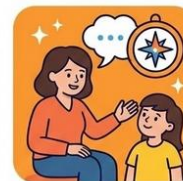
Z OPIEKUNEM / NAUCZYCIELEM