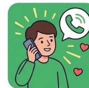
ZE SPECJALISTĄ (TELEFON)