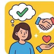
ZE WSPARCIEM EMOCJONALNYM